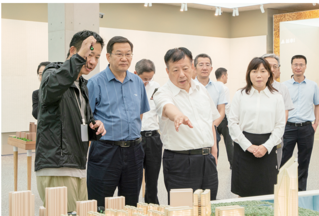
方伟、蔡锦军在天下秀数字科技创新产业基地调研。

本报讯(记者 谭华皓)9月16日,江苏省副省长方伟率调研组到北海考察调研。市委书记蔡锦军,市委副书记、市长李莉分别参加有关活动。当天,调研组一行先后来到铁山港公用码头、顺应储能、太阳纸业、惠科邦定、天下秀数字科技创新产业基地等企业及项目现场,听取中国—东盟产业合作区北海片区规划建设情况介绍,调研北海产业发展、项目建设成效,就企业生产、技术研发、项目提升等内容进行互动交流。近年来,北海市认真贯彻落实党中央、国务院和自治区的决策部署,加快发展向海经济,着力加强产业园区建设,持续开展精准招商,全面优化营商环境,大力推进项目建设,经济发展呈现基础稳、活力强、韧性大、后劲足的良好态势。调研过程中,企业代表纷纷表示,优越的营商环境给予企业扎根北海、投资兴业信心。调研组认为,北海区位优势突出,旅游资源丰富,产业配套完善,发展势头强劲,希望今后能加强沟通、增进交流,推动优势互补、合作共赢。蔡锦军和李莉对江苏省调研组的到来表示欢迎,江苏经济社会发展取得的巨大成就和成功经验值得北海学习和借鉴,希望今后能进一步拓展合作领域,特别是在园区建设和产业发展等方面深化合作,实现互利共赢发展。江苏省政府副秘书长黄澜、江苏省商务厅副厅长吴海云等江苏省政府代表团和省经贸代表团成员,自治区民政厅副厅长潘志武,市领导郑定雄、李继昭、孙环志,市政府秘书长李柏强参加有关活动。